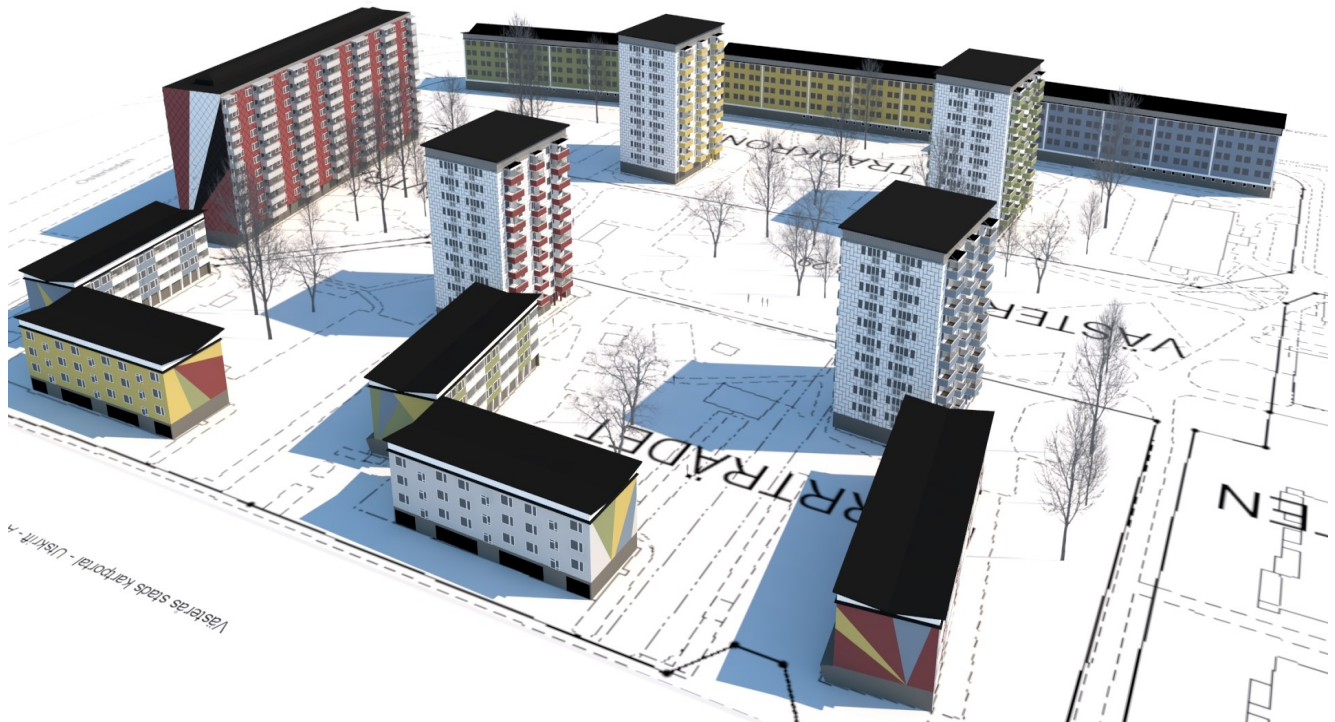
Förslag på en kommande fasadförändring