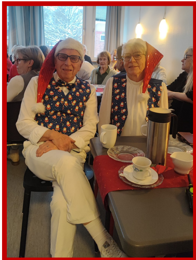
Vestarna i sina fina västar

Mötesplatsen kommer igång igen torsdag den 18 januari i den lilla stugan i stora lekparken kl. 14:00 som tidigare.